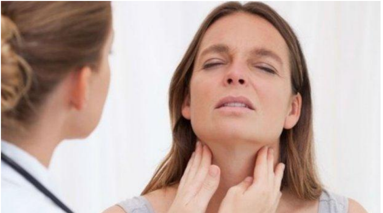
Одним із симптомів дифтерії є набрякле горло

Також при дифтерії з'являється специфічний солодкуватий запах з рота. Через деякий час уражене місце може набрякати.